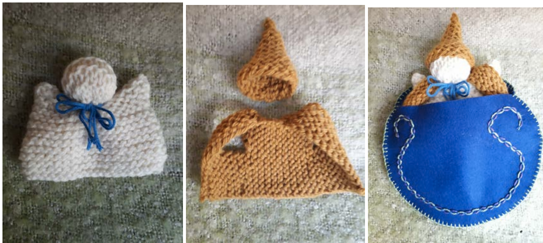
Lutin au tricot avec ses habits et son sac de couchage, 1 re classe

*Apprentissage des méthodes nouvelles, des projets nouveaux (par ex. «the seasonal projets»=les projets liés à la saison)