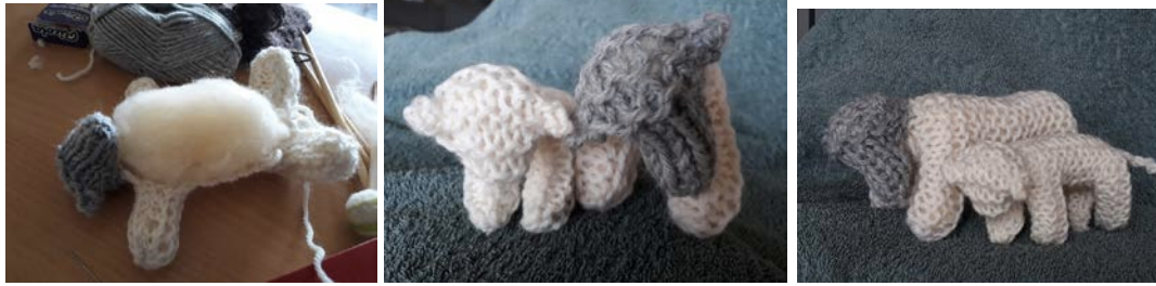
Mouton au tricot, 2 e classe

*Apprentissage des méthodes nouvelles, des projets nouveaux (par ex. «the seasonal projets»=les projets liés à la saison)