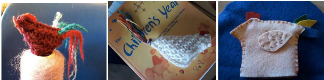
Coques au tricot et feutrine 1 re classe

*Nous faisons un journal du bord / un portfolio, ça me pousse à améliorer mes compétences en informatique, en photographie, en dessin et en expression écrite.